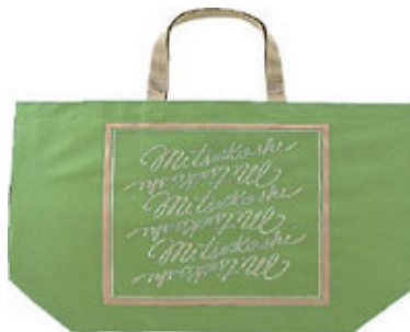
6月18日より発売予定の新品 ミディアムライトグリーン

お買い物に繰り返し使える「三越バッグ」の販売を開始して今年で5年目を迎えます。省資源とゴミを減らす環境保全活動の一環として開発されたこのバッグは、累計販売枚数が51万枚(2004年4月末)に達し、多くのお客様に支持されています。