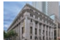
三井記念美術館 外観

TEL 050-5541-8600 (ハローダイヤル) https://www.mitsui-museum.jp/