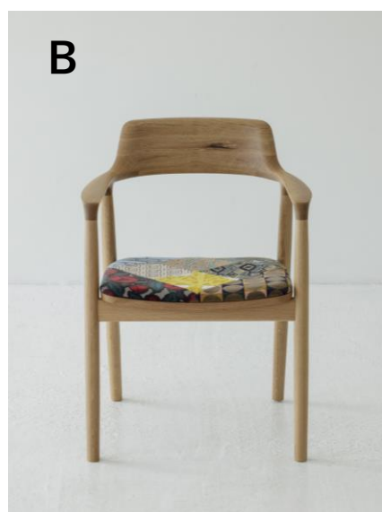
¥185,900 (本体¥169,000) オーク材/ナチュラルクリア