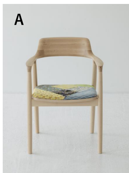
¥145,200 (本体¥132,000) ビーチ材/ナチュラルホワイト

URL : https://www.mistore.jp/store/shinjuku/shops/living/livingroom/shopnews_list/shopnews0102.html