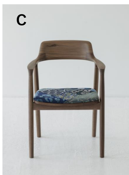
¥201,300 (本体¥183,000) ウォルナット材/ナチュラルクリア