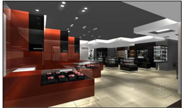
店内イメージ（フーズギフト）

大切な人に贈るための、こだわりのギフトをご用意。デビットマイヤーがプロデュースする焼菓子<SOLA>、新しい飴の形<Ameya Eitaro>、サロンドショコラでも好評の<Tokyo chocolate>と、三越伊勢丹限定、東京限定のラインナップです。