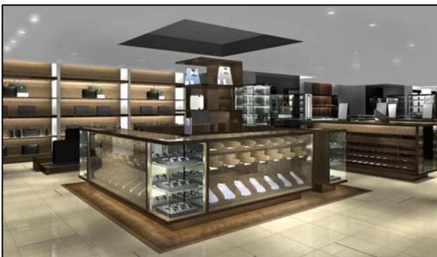
店内イメージ（ビジネスシーン）

※ 主なブランド：〈サンタマリアノヴェッラ〉、〈グローブトロッター〉、〈ジョンスメドレー〉 〈999.9〉、〈ステテコドットコム〉、〈ビルケンシュトック〉など