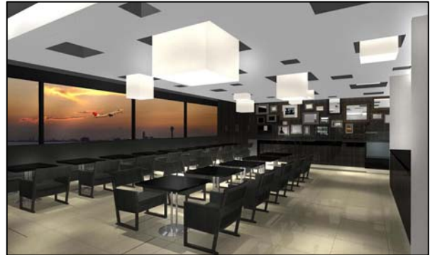
店内イメージ（カフェ）

ショッピングスペースと隣接し、飛行場を一望に見渡せる、開放的でくつろげるオリジナルカフェを設置。JAL ファーストクラスやビジネスクラスで採用している、こだわりの、川島良彰氏監修のコーヒーを提供するほか、ソフトドリンク・アルコール・素材にこだわったフードやデザートなどを揃えます。Wifi・充電もご利用いただけます。