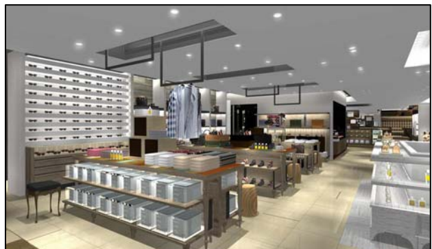
店内イメージ（くつろぎのシーン）